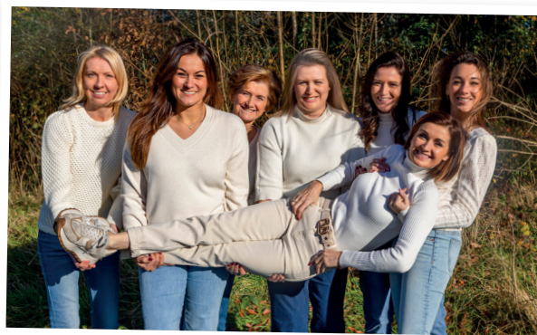
Evelientje Angeltje Mammietje Biancatje Beccatje Lotje Neleke

Mode-, Reiki- en schoonheidsspecialiste inspired by Life